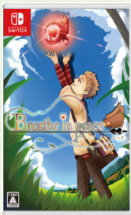
Nintendo Switch パッケージ