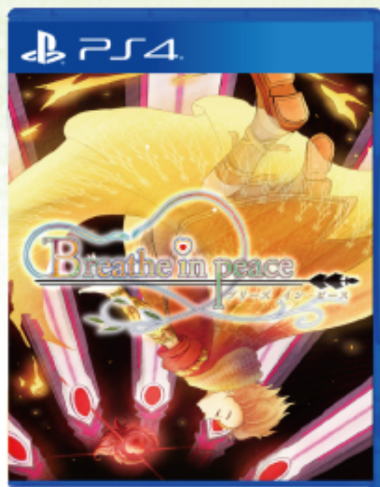
Play Station 4 パッケージ