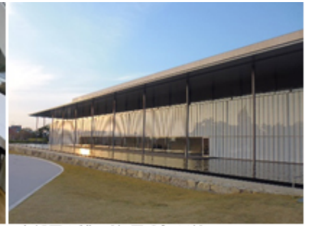
【京都国立博物館 平成知新館】